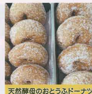
天然酵母のおとうふドーナツ

当店の店名の由来ともなっているシフォンケーキ。グルテンフリーにこだわり、ふわふわに仕上げています。いろいろな種類があります。