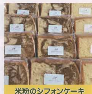
米粉のシフォンケーキ

当店の店名の由来ともなっているシフォンケーキ。グルテンフリーにこだわり、ふわふわに仕上げています。いろいろな種類があります。