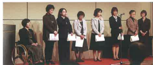
第1回受賞者の皆様

ご応募にあたり提出いただいた書類の個人情報に関しては、「個人情報保護法」を遵守し、選考委員会、贈呈式運営(受賞者紹介時の利用を含む)および当法人の記録目的以外には利用いたしません。