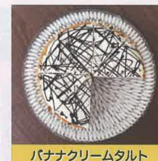
バナナクリームタルト

生地におとうふと自家製味噌を練り込んだ卵乳不使用のヴィーガンドーナツです。天然酵母で膨らませた、深い風味を楽しめます。